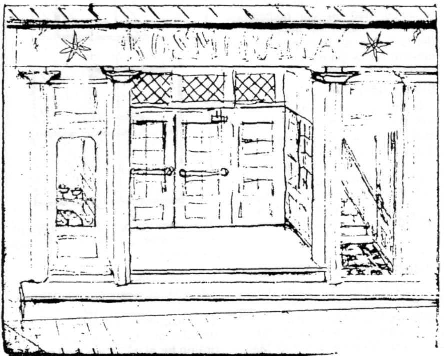
Skitse af facaden på den nye biograf - tegnet i 1930-erne.