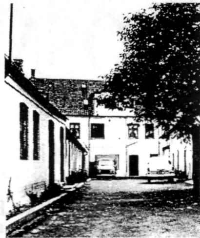
Gården til nr. 26 med biografen til højre. Ca. 1970.

ge billetter. Der var en lille lem ved billetsalget. En billet kostede 15 øre for børn og 25 øre for voksne - men det var jo mange penge dengang. Det var mest danske film, der blev vist, men efterhånden kom der også en del udenlandske, bl.a. Chaplin-film. Alle film helt frem til ca. 1930 var stumfilm.