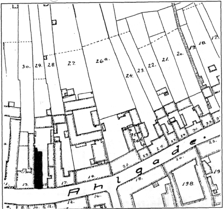
Grundplan med angivelse af biografens nye placering.