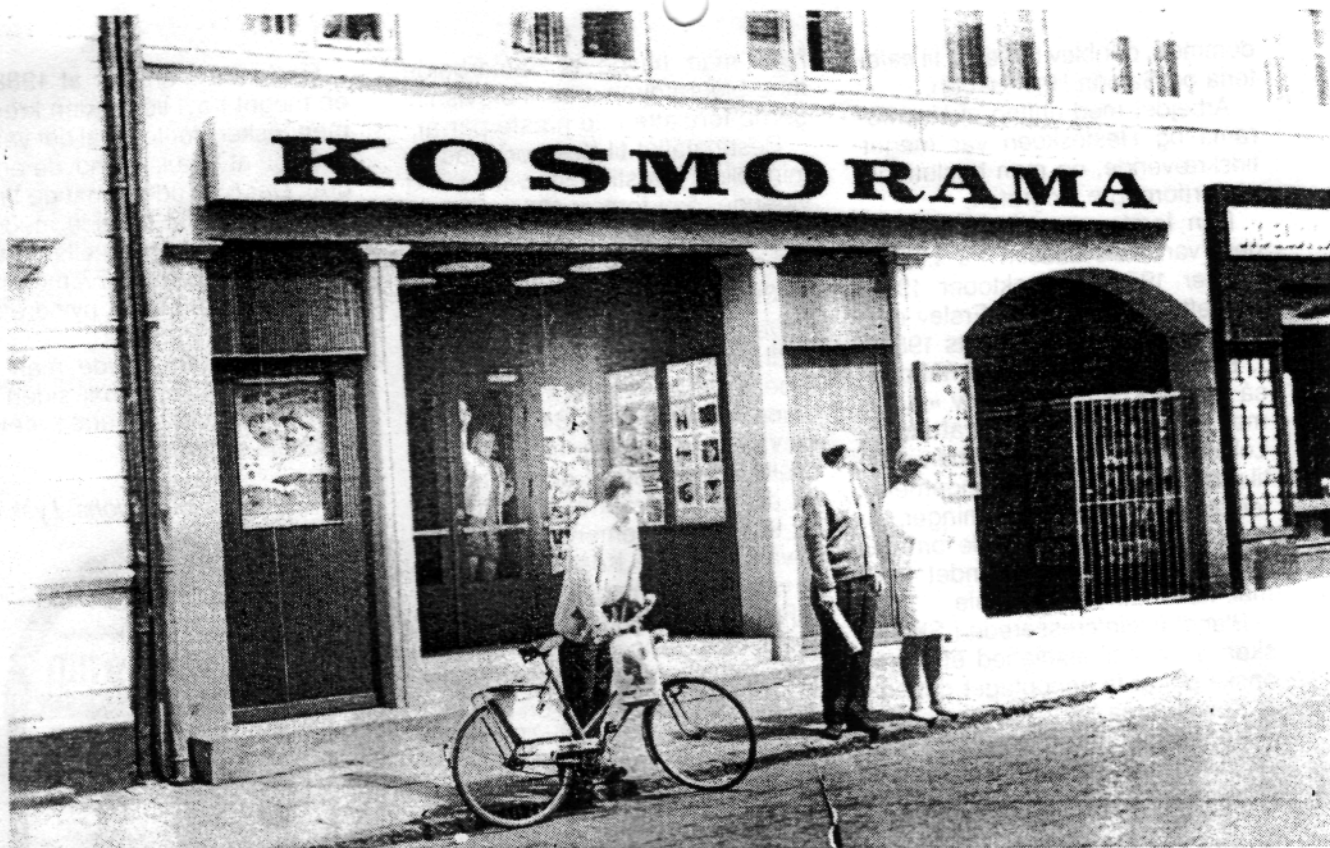
Kosmorama ca. 1970.